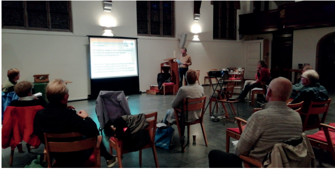
Toelichting beleidsplan in Wijkkerkenraad Velsbroek

duidelijk was uitgesproken in de gemeentebesprekingen. Voorbeelden als Hart voor Velsbroek en Asphalt laten al zien wat deze projecten kunnen betekenen. Ook willen we graag een organisatievorm voor onze gemeente die past bij deze (corona)tijd. Er zijn nu al groepen mensen die zich inzetten voor bijvoorbeeld de digitale vieringen en veiligheid, het is